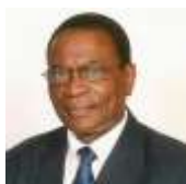
Корва Адар Гомбе Университет Ботсваны (Ботсвана)