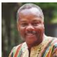
Молефи Кете Асанте Университет Темпл (США)