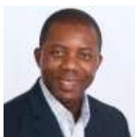
Лембе Тики Университет Коннектикута и ISA (США)